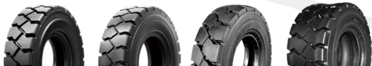
ZM806 ZM722 ZM722A ZM712

专为叉车设计，胎体特别加强，负荷大，行驶面宽，行驶平稳，抓着力强。特殊的配方设计使轮胎具有良好的抗切割及耐磨性能。