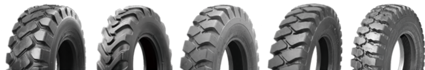
E-3C/L-3C G-2/L-2 E-3B/L-3B E-3S E-3F