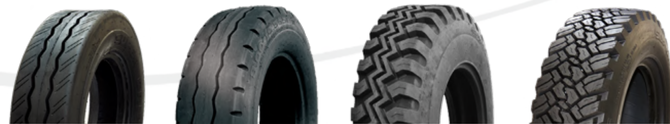
S8802 S8804 S8805 S8807