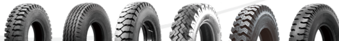
H-LUG H-RIB GK799 ZM668 ZL719 NJ328