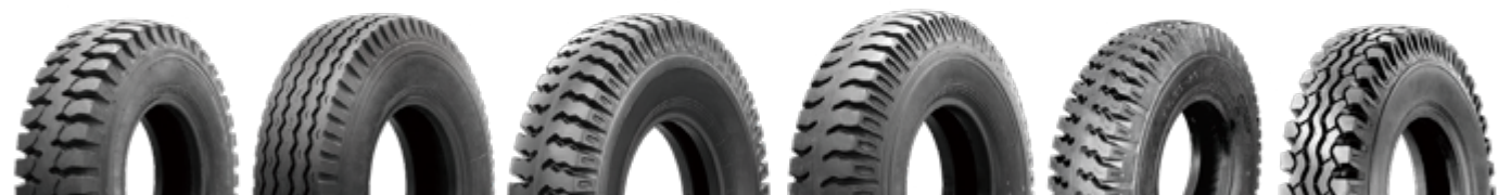
H-LUG H-RIB XT888 ZL319 HL928 M777