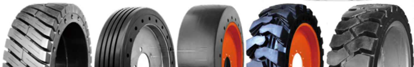
TR-1 SR-2 SM-2 G-2 TR-6